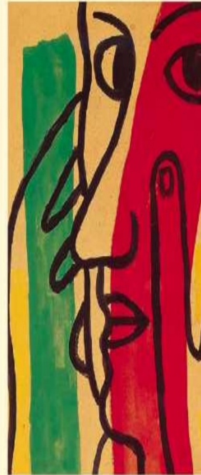
Illustrations du poème par l'artiste Fernand Léger

un bien = une possession imprescriptible which cannot be legally taken away pourtant however rêvaient dreamed interdit forbidden exemplaires copies